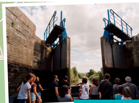
4 L'écluse du Boël