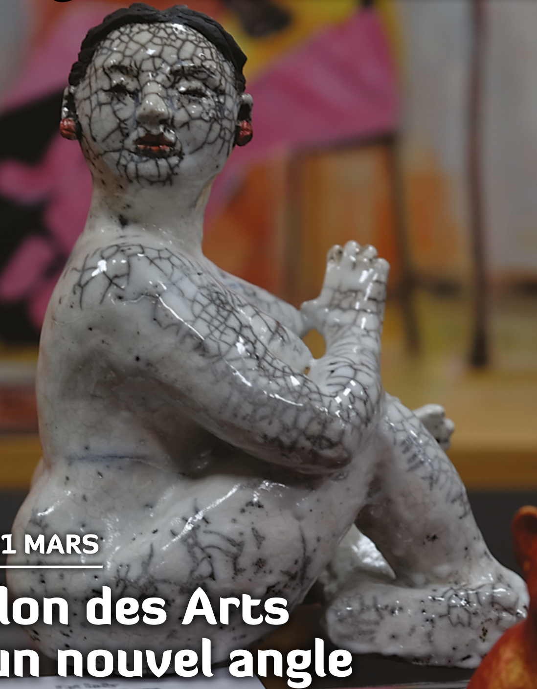
Sculpture : Meryl Quiguer

La revue municipale de Guichen•Pont-Réan