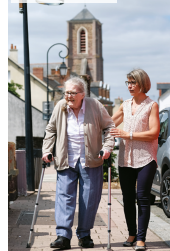
Les aides à domicile du CCAS interviennent dans les centres-bourgs et les campagnes de Guichen Pont-Réan.

■ Contacts : 02 99 57 39 87 ads.guichen@laposte.net - Bât. le Réso, 26 rue du Commandant Charcot.